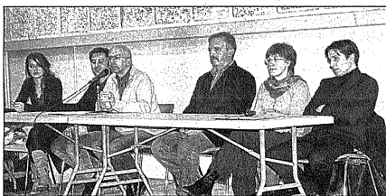
Les différents intervenants

Samedi 18 février. Objectif de la réunion publique : Le but de cette réunion était d'atteindre plusieurs objectifs : - permettre au public d'identifier certains des acteurs principaux et parfois incontournables.