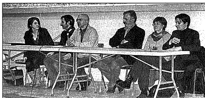
Economies d'énergie, un vrai défi pour demain

Le PTZ+ est destiné à l'achat dans le neuf sous certaines conditions et certains plafonds suivant la situation géographique. Ce prêt peut être majoré suivant le type de bâtiment à construire ou acheter et de la qualification du bien (BBC : Bâtiment Basse Consommation).